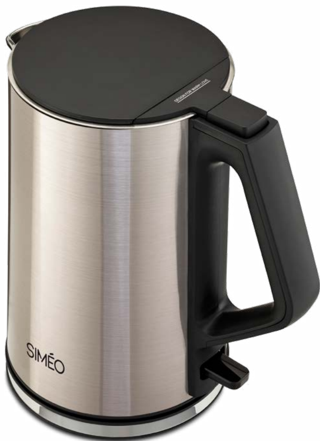
Bouilloire paroi froide CT260